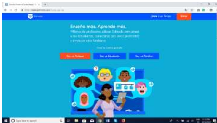
Captura 1. Página de inicio de Edmodo.

En este sentido, los profesores de cada año y en cada sección, crearon una cuenta en esta plataforma. Los alumnos tienen el código o clave requerido para ingresar al sitio. Una vez se hace clic sobre SOY UN ESTUDIANTE, como se ve en la captura 1, el alumno ingresa la información solicitada en la página denominada Edmodo para Estudiantes. Captura 2.